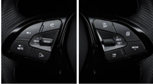
Hands-free ses düğmeleri / Hız sabitleyici düğmeleri