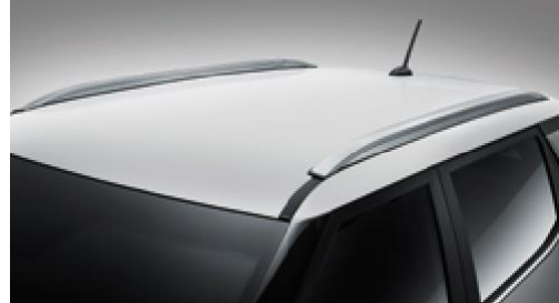
Modaya uygun g¼m¼ő tavan rayları