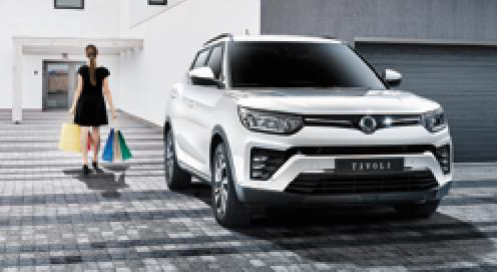
Otomatik kapı kilitleme sistemi