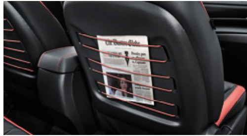
Koltuk arkası cebi