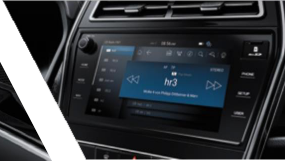
9" HD AVN sistemi / geri görüş kamerası ve akıllı telefon Bluetooth bağlantısı.