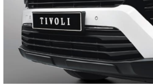
Aerodinamo n Panjur