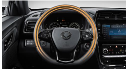
Isıtmalı deri direksiyon simidi