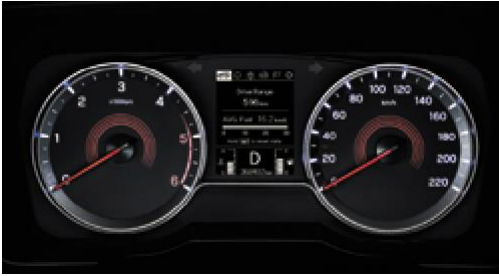
Standart gösterge paneli