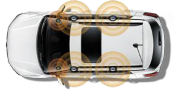
6 hoparlör (4 kapı hoparlör, 2 ön tweeter)