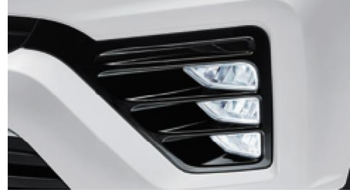
LED sis lambaları (n ve arka)