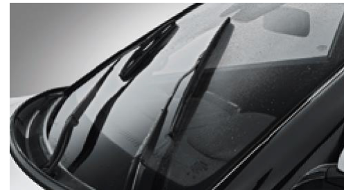
Aero tip silecekler

Bu broő¼rde gsterilen ve yazılan opsiyonlar ve donanımlardan bazıları Showroom'da teőhir edilen aralarda farklılık gsterebilir. Firma t¼m teknik zellikleri nceden bildirmeden deđiőtirme hakkına sahiptir. En g¼ncel bilgiler iin bayinize baővurunuz.