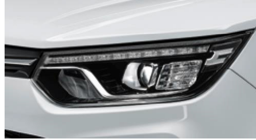
LED n ve arka far