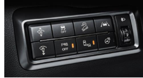
Çoklu düğme konsolu