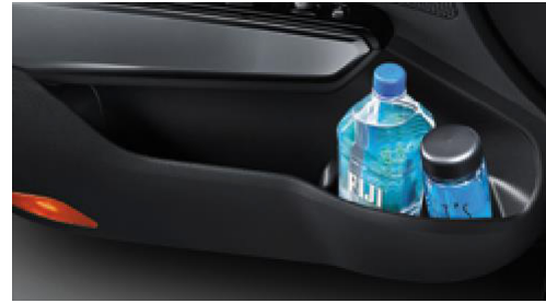
Geniş hacimli kapı cepleri