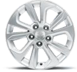
16" alaőım jant 205/65R lastik

TIVOLI, s¼r¼ő rahatlıđınızı ve keyfinizi daha da artıracak bir dizi donanım ile gelir.