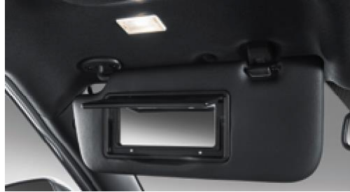
Işıklı makyaj aynalı güneşlik