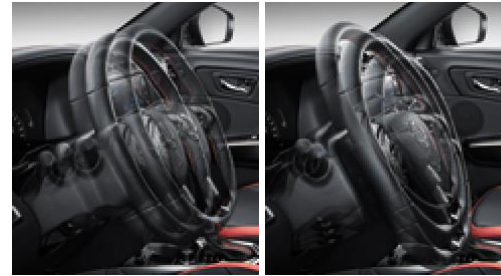
Teleskopik ve eğimi ayarlanabilir direksiyon kolonu