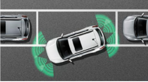
Park asistanı (n & arka)