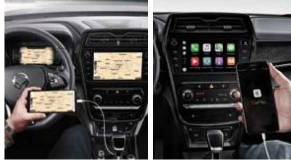
Google Android Auto ve Apple CarPlay