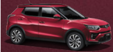
Kiraz Kırmızı (RAV)