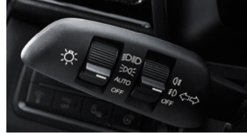
Otomatik far kontrolü