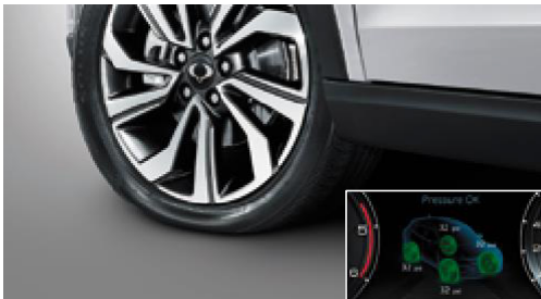
Lastik basıncı gr¼nt¼leme sistemi