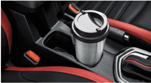
Orta konsol bardaklıklar