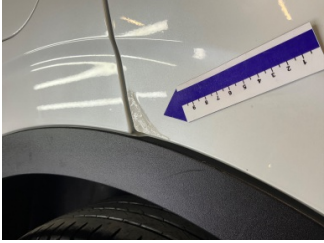
Kapı, sağ arka, Kapı, sağ arka > Rötüş